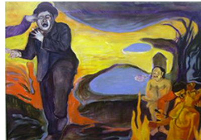
Sidyon Cucaro, OLLIE'S ADVENTURES, 2007