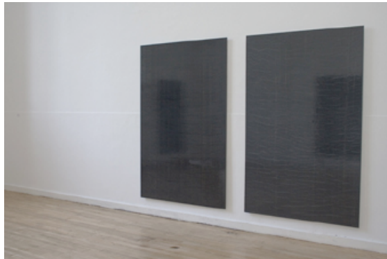
Vincent Vulmsa, THE DANCE OF THE SIGNS, 2008